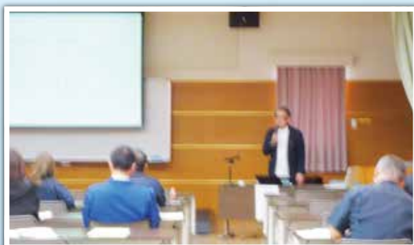
(株)りゅうせきフロントライン様