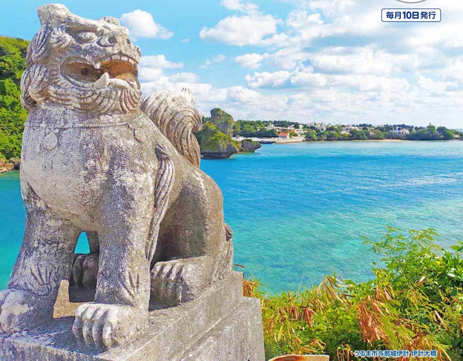
うるま市与那城伊計 伊計大橋