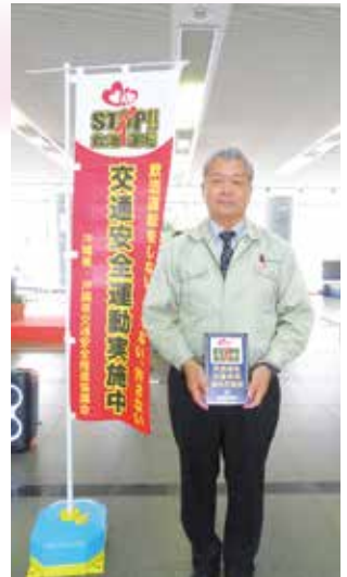
浦西産業株式会社