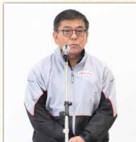
いすゞ自動車九州(株) 沖縄支社 田多支店長 ご挨拶