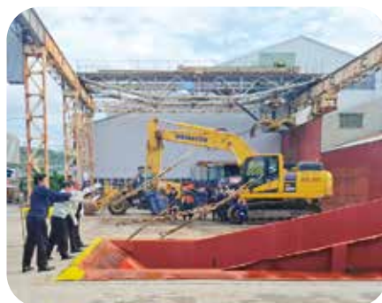
原料さとうきび投入