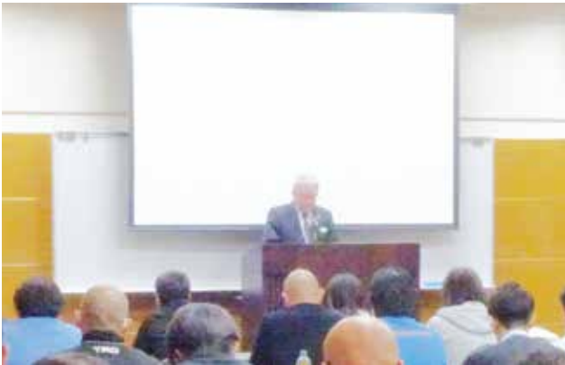
新垣副会長 開会挨拶

各法改正の講話では「中小受託取引適正化法(通称：取適法)」の規制ポイントや改正内容、「改正物流効率化法」の「荷主・物流事業者に対する規制的措置」について、「改正貨物自動車運送事業法」の「トラック事業者の取引に対する規制的措置」や「トラック適正化二法」についての説明がありました。