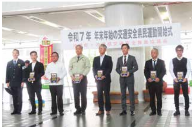
飲酒運転根絶対策優良事業所