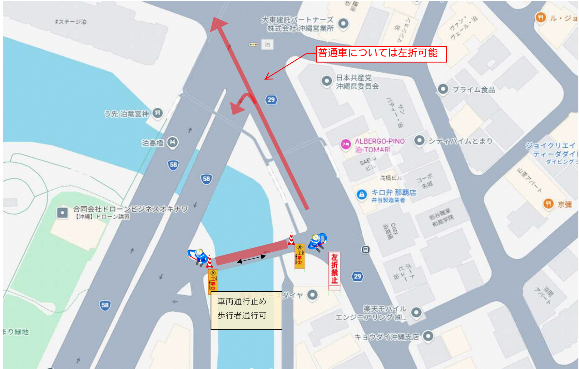
保安施設設置計画（周辺図）