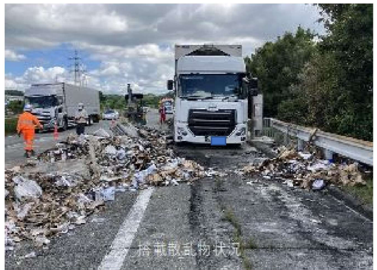
九州自動車（福岡）での車両火災