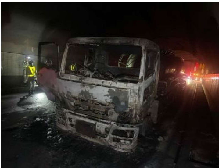
九州自動車（熊本）でのトンネル車両火災