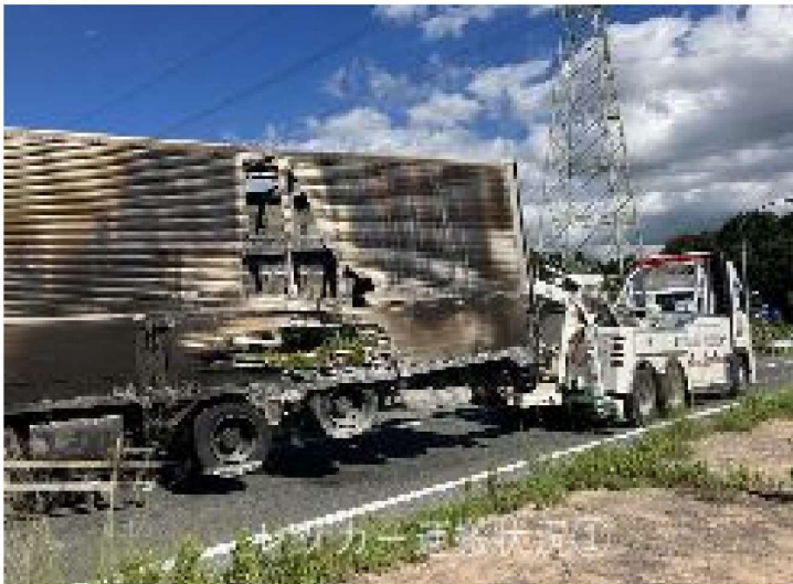
九州自動車（福岡）での車両火災