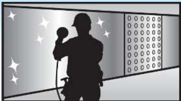
塗膜除去完了後に、鉄面までのケレン作業を電動工具にてピカピカになるまで行います。