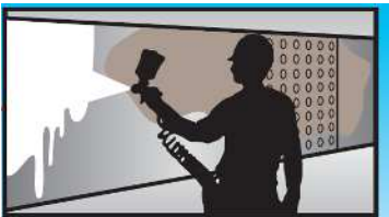
架設より、20年経過し老朽化した鋼橋を特殊な剥離剤により、古い塗膜を軟化させ、塗膜を除去します。