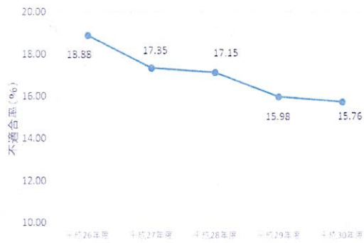
不適合率の推移 (最近5年間)