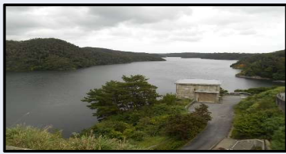
福地ダムの様子(参考: R1.6.21 100%記録時)