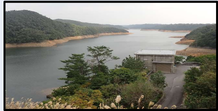
福地ダムの様子(12/31 14時) 写真: 北部ダム統合管理事務所提供