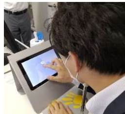
タブレット型視野計